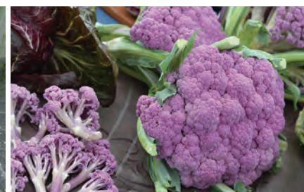
カリフラワー 紫カリフローレ

通常のカリフラワーよりも収穫期が遅く、花軸が伸び出す頃に収穫します。一般的な白い品種のほか、紫色の品種もあります。甘く子供が喜んで食べる味が特徴です。