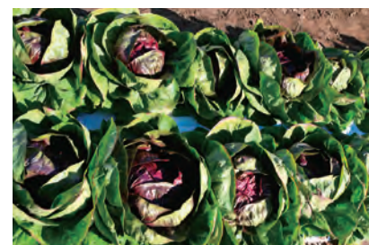
トレビス ラディッキオ

ヨーロッパに多い非結球キク科葉菜類です。レタスとは別種ですが、農薬取締法上のレタス類に属します。